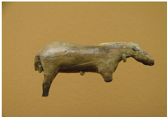
Το άλογο της Λούρδης Le cheval de Lourdes

Η περιοχή της Λούρδης κατοικήθηκε από την προϊστορική εποχή. Πολλά ευρήματα (συμπεριλαμβανομένων εργαλείων, κοσμημάτων, κεραμικών και σαρκοφάγων) έχουν ανακαλυφθεί, μεταξύ άλλων, στο σπήλαιο Εσπελύγκ. Στο Εθνικό Αρχαιολογικό Μουσείο εκτίθεται το «Άλογο της Λούρδης», ένα ειδώλιο μήκους 7,3 εκατοστών που χρονολογείται από το 13.000 π.Χ.