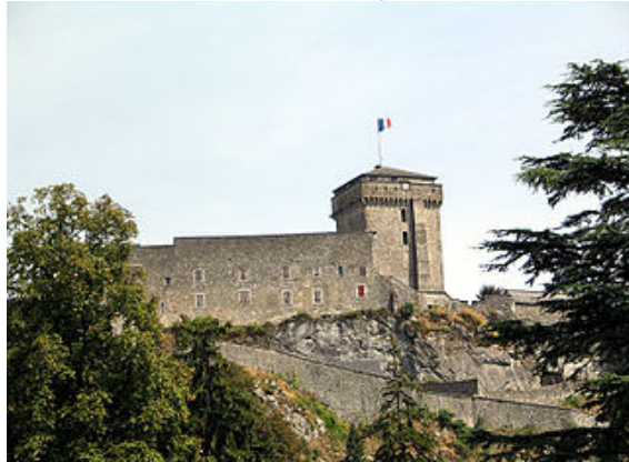
Το φρούριο της Λούρδης La forteresse de Lourdes

φρούριο και να μεταστραφεί στον Χριστιανισμό. Την ημέρα της βαπτίσεώς του, ο Μιράτ πήρε το όνομα Lorus, το οποίο δόθηκε στην πόλη, γνωστή τώρα ως Λούρδη.